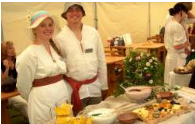
“Piimapreili 2007” lk. 4