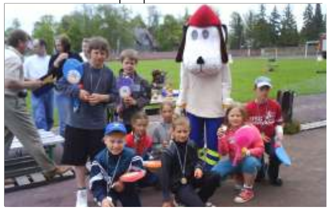
Tuletõrjesport pakub... lk. 2