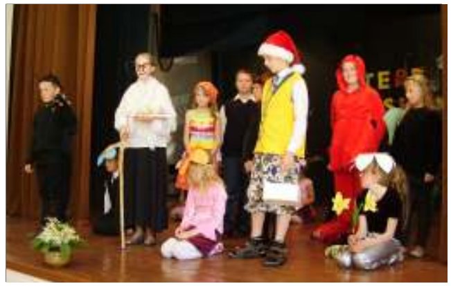
Viimane koolipäev lk. 3