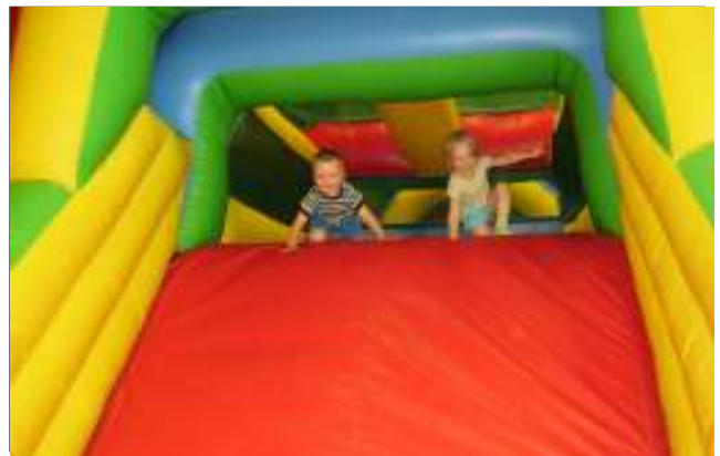
Mudilased mängumaal lk. 3