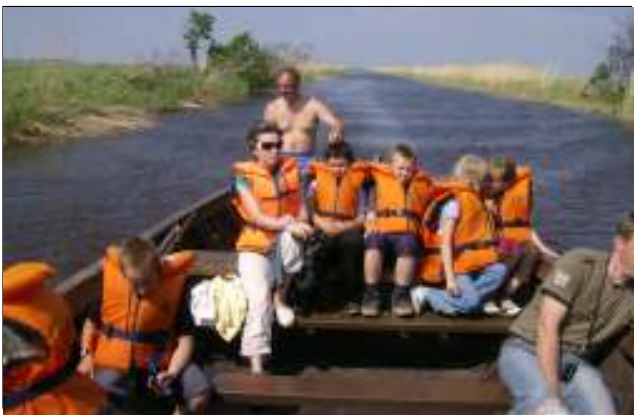
Preemiareis... lk. 2