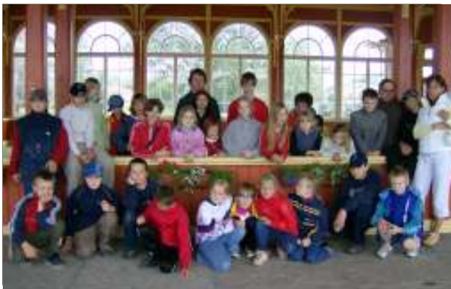
Kevad Lõpe koolis lk. 3